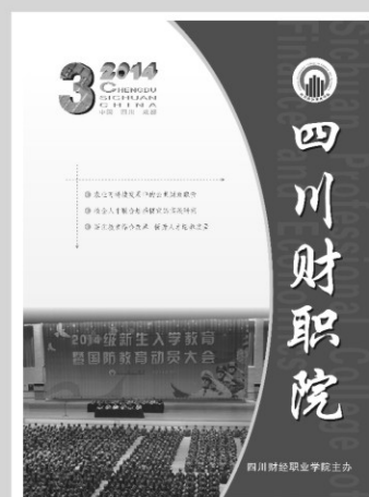
《四川财院》2014年第三期 (总第85期)

地址:成都市龙泉驿区驿都西路4111号 邮编:610101 电话:84642053 网址:www.sccpfe.cn E-mail: sccxk@163.com 登记刊号:四川省连续性内部资料 准印证第01-052号 印刷:四川煤田地质制图印刷厂 照排:四川煤田地质制图印刷厂照排部 出版日期:2014年10月 本期印数:3500册 发行范围:本系统内